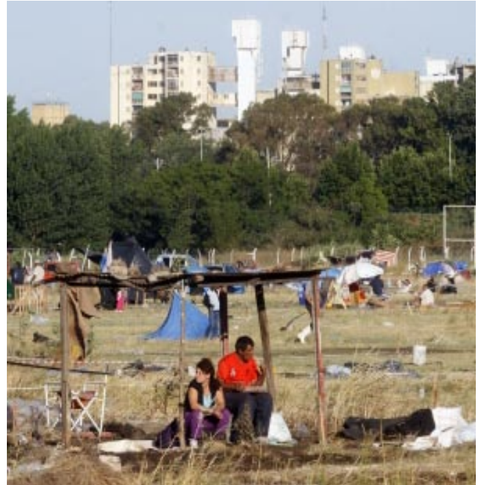
Bolivianos en el parque Indoamericano

Los responsables de las muertes y los heridos de los bolivianos en la Argentina son : la presidenta Cristina Fernández de Kirchner, el gobierno de la ciudad de Bs. As. Mauricio Macri y el gobierno traidor del MAS de Evo Morales (como gobierno expulsor) gobiernos manchados de sangre hasta la medula.